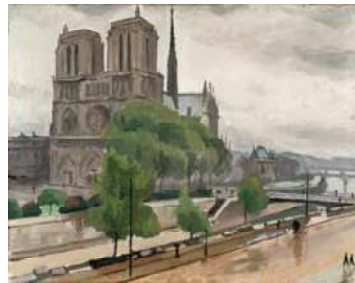
皮埃尔·阿贝尔·马蒂斯《圣德教堂 雨天》1924 年左右