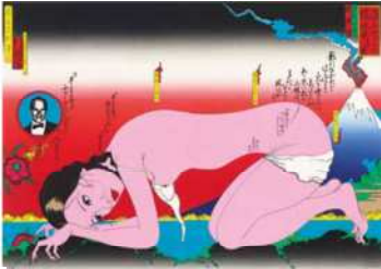
横尾忠则 《有爱当窗的风景》 1968-2002