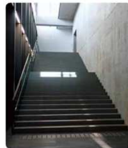
入口大厅楼梯 (左侧)

这座建筑不仅仅用来展示美术作品，更是各种艺术融合之地。该设计出自世界著名建筑师安藤忠雄先生之手。于简单明快快的结构之中，实现复杂多样的空间体验。入口大厅的宽敞空间控制了光线，营造出一种稳重大气的氛围，而与此形成对比的是围绕展厅的玻璃回廊，充分引入自然光线等。建筑内部的各个部分呈现出富于明暗变换的表情。此外还有多个魅力十足的空间，如室内架空楼梯、室外大阶梯、广场等，可以尽情享受观赏与漫步的乐趣。