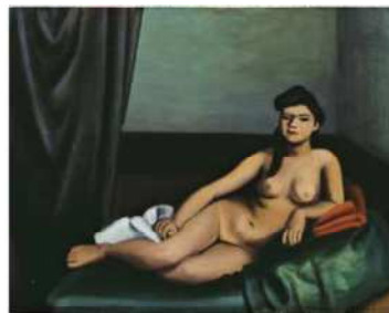
安井曾太郎《裸女》1924 年

本馆主要收藏有东山魁夷、高山辰雄、加山又造等日本画坛代表性画家以及梅原龙三郎、安井曾太郎、小矶良平等巴黎游学派西洋画家的个性作品。海外作家方面，主要收藏有印象派画家雷诺阿、野兽派画家马蒂斯和弗拉曼克、巴黎派画家郁特里罗、洛朗桑、夏加尔等人的绘画与版画，以及罗丹、布德尔的雕刻作品。还新收藏了近年来以神户为中心而活跃的西洋画家冈谷义郎及西村功以及前卫美术集团（具体美术协会）的上前智祐及堀尾贞治。