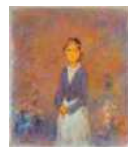
冈谷义郎《靠墙而立的裸衣女子》1973 年