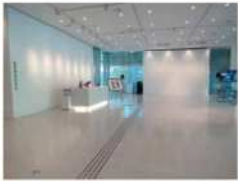
开放工作室 (Open Studio)