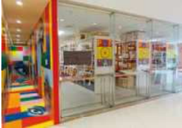
“眼睛走廊”与资料厅