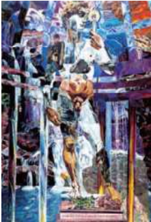
横尾忠则 《兴开图(基罗与北斋的因果联系)》 1990