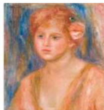
皮埃尔·阿贝尔·马蒂斯《少女》1915 年