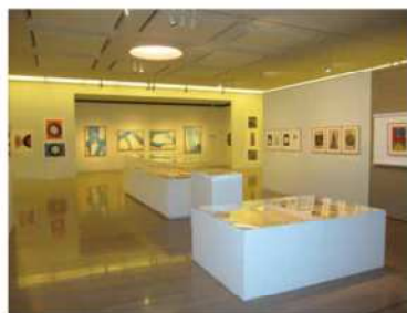
"Izumi Shigeru Exhibition" held 2015/7/17 - 8/16

BB 广场美术馆作为株式会社 SHIMABUN Corporation 创建 100 周年纪念事业的一个组成部分，于 2009 年 7 月 7 日开馆。倡导“让艺术走进生活”，为了让更多人亲近一件一件的艺术作品，同时为地区社会的艺术文化振兴做贡献，努力打造开放型美术馆。在展厅欣赏后，可以在能看见雕刻作品的餐厅或咖啡厅，享受悠闲时光。