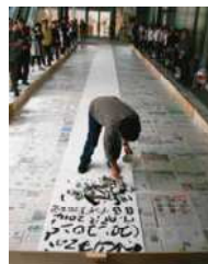
堀尾贞治《浪来浪去》2014