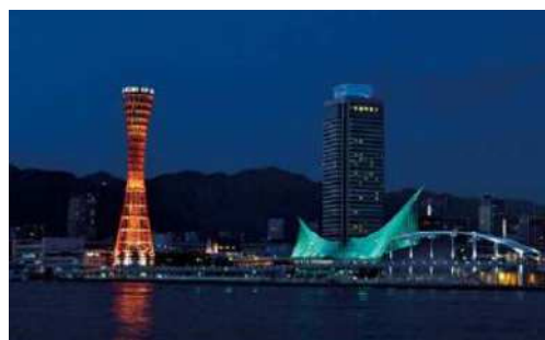
神户美利坚公园 (Meriken Park) (神户港)

Many wonderful tourist spots are situated not far from Kobe Museum Road. It's a great idea to combine art museum visits with these other sights.