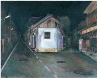
横尾忠则 《暗夜光路 N 市 - 1》