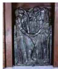
奥古斯特·罗丹《三个波兰》1928 年