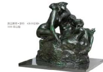
奥古斯特·罗丹《水中女神》1888 年以后